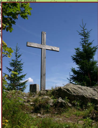
Poledník (1 315 m n.m.) výhled z 37 m vysoké rozhledny, horská smrčina, vrcholový kříž