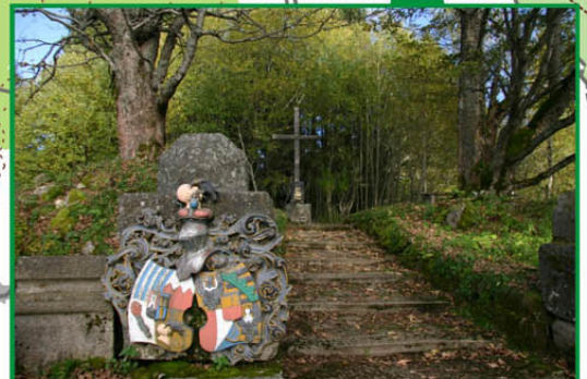
Knížecí Pláně (1 005 m n.m.) Zaniklá obec s pietně upraveným hřbitovem a místem kostela sv. J. Křtitele.