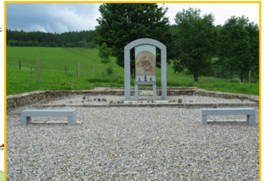
Nový Svět (930 m n.m.) V roce 2010 místo zbouraného kostela sv. Martina pietně upraveno, hřbitov obnoven.