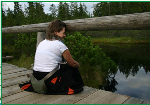
Tříjezerní slat' (1 067 m n.m.) Typické horské vrchoviště s třemi jezírky a výskytem kleče a rosnatky okrouhlosté.