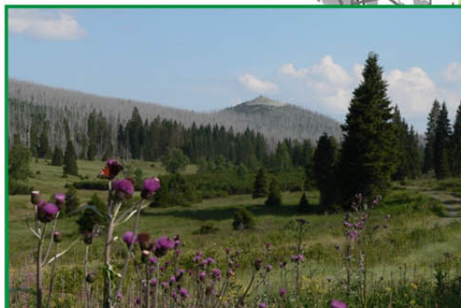
Březník (1 134 m n.m.) Výhled na Luzenské údolí s holým vrcholem Luzným patří k nemalebnějším na celé Šumavě. V myslivně Březník (Pürstling) je dnes expozice K. Klostermanna a informační středisko NPŠ.